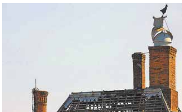
El nido de las cigüeñas en la parte alta de la antigua fábrica cervecedera.