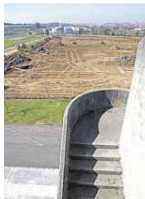
La polémica parcela.

El Colectivo de Estudiantes Contra la Semana Negra (Ceclasa) acusó ayer al Ayuntamiento de “mentir” porque en terrenos anexos al Campus no sólo se instalará ese evento sino que en el futuro habrá otro tipo de espectáculos lúdicos y musicales.