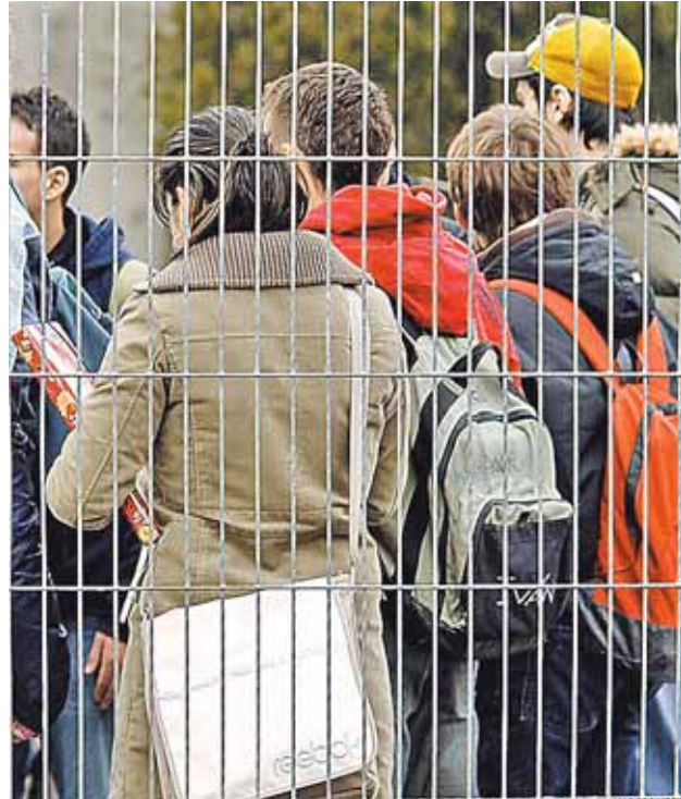
Casi seis de cada diez repetidores de Secundaria son chicos.

Cuanto peor es el nivel educativo de los padres, la tasa de fracaso escolar de los alumnos es más alta. Esta es una de las conclusiones de la primera parte del informe elaborado por el grupo FIES-Asturias que ayer fue presentado en Oviedo. Según este estudio –encuestaron a 2.535 alumnos– el 17% de los alumnos de tercero de Secundaria ha repetido algún curso. De este grupo, la mayoría –más de seis de cada diez– tiene padres con un bajo nivel educativo y sólo el 7% tiene padres con estudios universitarios. “Si los padres tienen estudios medios o universitarios los alumnos tienen un tercio o más de posibilidades de pasar a Bachillerato que los de familias sin estudios”.