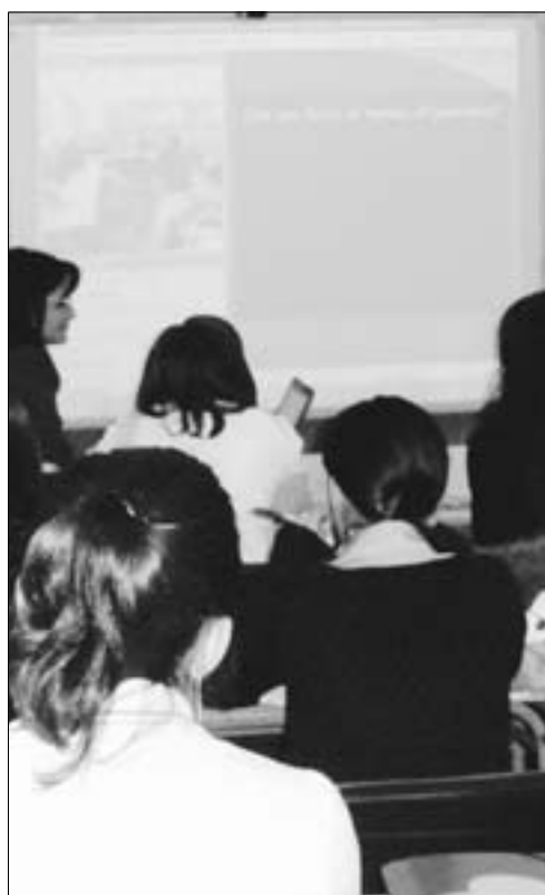
► Los pixuetos, durante la videoconferencia, ayer.